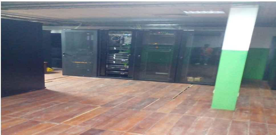
Salle des serveurs et routeurs